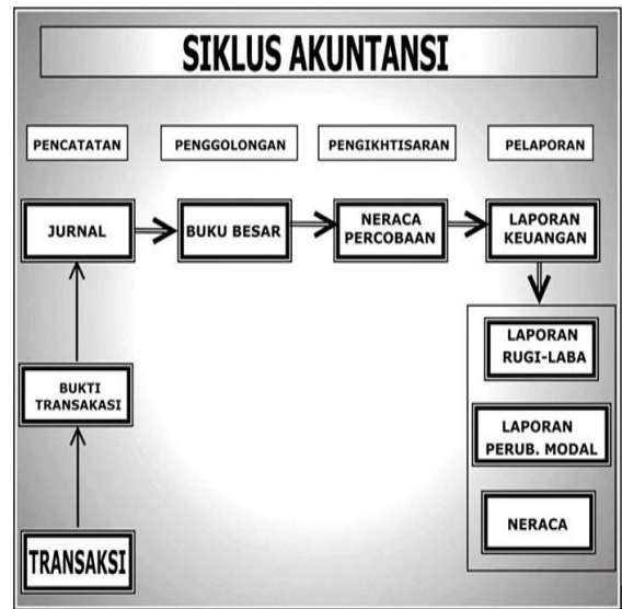
Gambar 4. Siklus Akuntansi

Sebelum sampai pada desain proses sistem komputerisasi akuntansi, terlebih dulu kita harus memahami prosedur pengolahan data akuntansi yang manual. Dalam kegiatan pengolahan data akuntansi manual, kegiatannya dimulai dari tahapan pencatatan ( recording ), pengelompokan ( classifying ) pengikhtisaran ( summarizing ) sampai pada tahap pelaporan ( reporting ). Proses transformasi data akuntansi menjadi informasi akuntansi atau yang disebut laporan keuangan dilakukan melalui beberapa tahap sehingga tahapan tersebut menjadi suatu siklus yang disebut siklus akuntansi yang bersifat baku sesuai dengan kaidah yang berlaku dalam sistem akuntansi. Siklus akuntansi secara sederhana dapat digambarkan sebagai berikut: