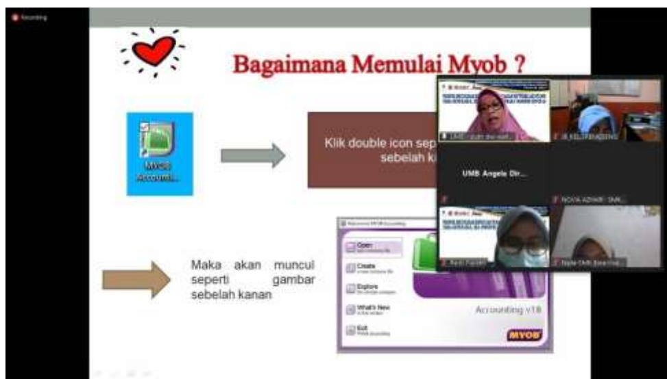
Gambar 5. Pemaparan Narasumber (Putri Dwi Wahyuni, SE.,M.Ak) Mengenai Pengenalan MYOB