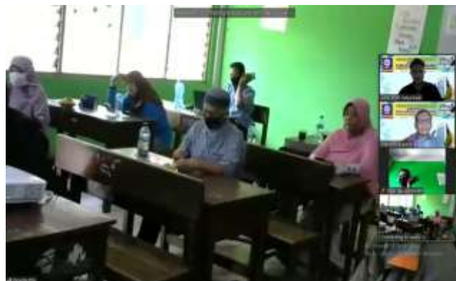
Gambar 3. Peserta Praktik Zoom Cloud Meeting