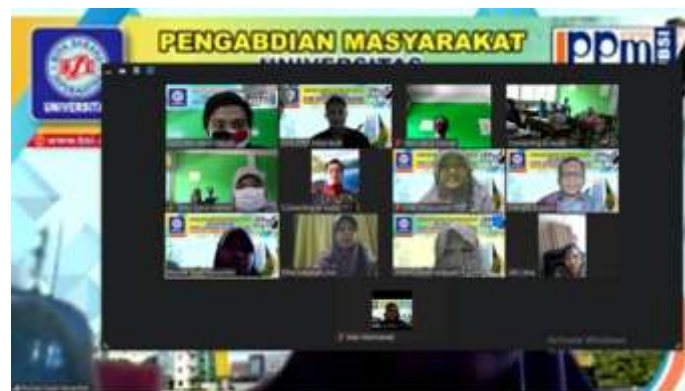
Gambar 2. Pemberian Materi Pelatihan